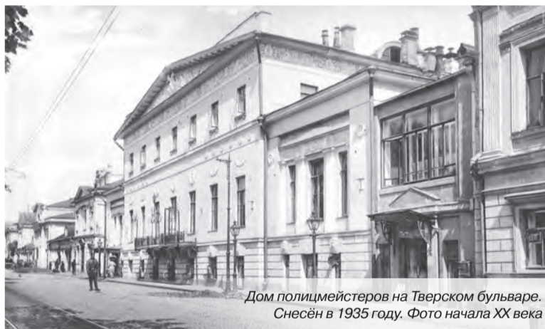
Дом полицмейстеров на Тверском бульваре. Снесён в 1935 году. Фото начала XX века