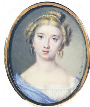
Портрет Екатерины Васильчиковой. Миниатюра неизвестного художника

предстаёт совсем иным человеком. В одном из писем к писателю Николаю Гоголю фрейлина русского императорского двора Александра Россет-Смирнова рассказывает: «Лужин - удивительный полицмейстер... Он так добр и благороден, вместе и строг, и нравственен во всех отношениях; но что может отдельное лицо?»