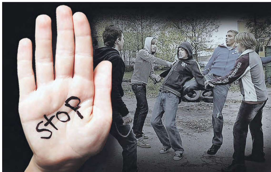
Коллаж Евгения КАРТАШОВА

му шли постепенно, не успели выработать правила, ограничивающие его «волчью» сущность. Сейчас мы, преодолевая себя, наконец, становимся по-настоящему гуманным, социально ответственным обществом. На этом пути труднее всего оказалось детям: их растерянные родители не могут быть ориентирами для них.