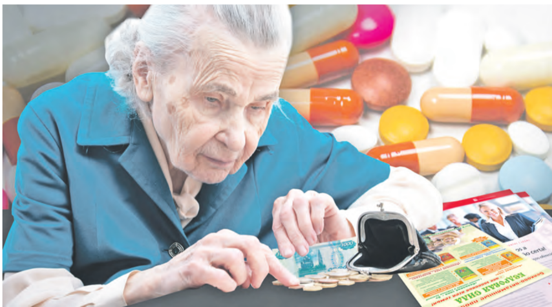
Коллаж Евгения КАРТАШОВА